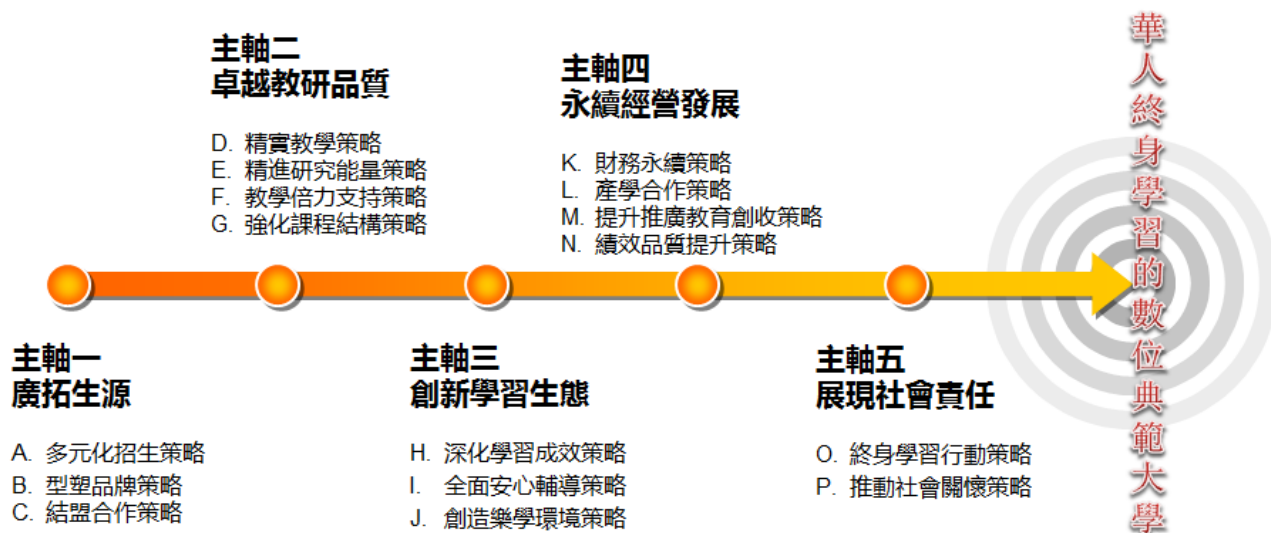
「109-112 年度中長程發展計劃」五大主軸

本校為因應空中教育發展趨勢，提升教育品質，增進教育績效，並促進學校財務之彈性運作。依據「109-112年度中長程發展計劃」五大主軸及「111年度財務規劃報告書」為架構，落實本校中長程五大主軸績效目標：