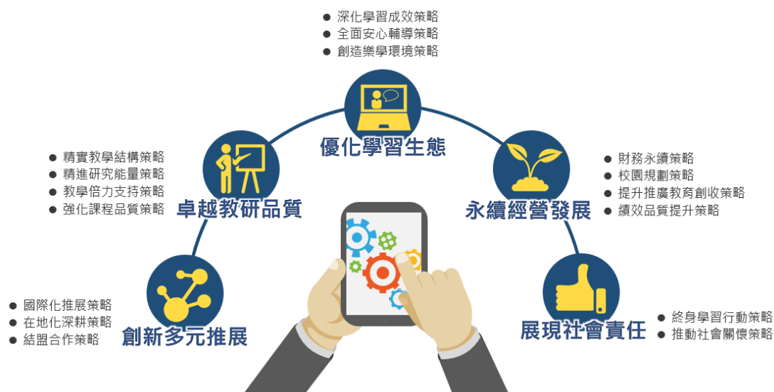
「109-112 年度中長程發展計畫」五大主軸

國立空中大學依「大學法」及「空中大學設置條例」設立，使用視聽傳播媒介方式辦理成人進修及繼續教育，以提升國人知識水準。國內高等教育大學校院雖多，但國立空中大學是唯一一所不同型態的大學，空大的存在具有多種不同的教育意義，包括：提供給早期失學者再一次進修的機會；提供在職人士繼續進修最便利的管道；提供離島居民接受高等教育的機會；提供弱勢族群、身心障礙者最適當的學習模式；提供中高齡失業者進修機會，建立其二次就業的信心；更重要的是，塑造了「人人有書讀、處處是教室、時時可讀書」的終身學習社會。在內部控制制度方面，設定整體層級目標如下：