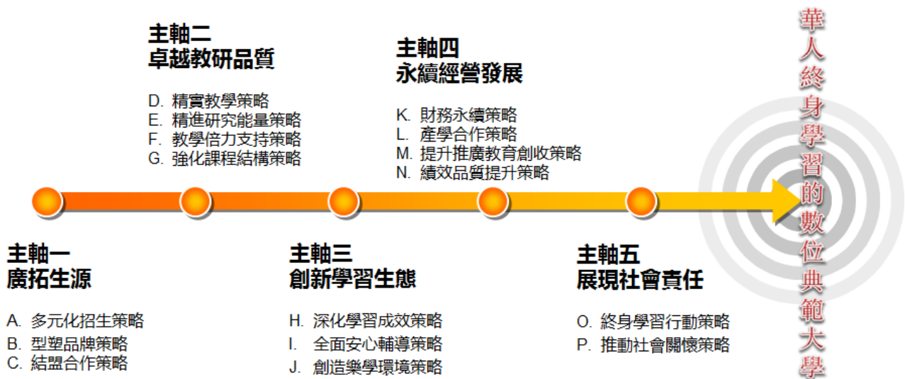
「105-108 年度中長程發展計畫」五大主軸

國立空中大學依「大學法」及「空中大學設置條例」設立，使用視聽傳播媒介方式辦理成人進修及繼續教育，以提升國人知識水準。國內高等教育大學校院雖多，但國立空中大學是唯一一所不同型態的大學，空大的存在具有多種不同的教育意義，包括：提供給早期失學者再一次進修的機會；提供在職人士繼續進修最便利的管道；提供離島居民接受高等教育的機會；提供弱勢族群、身心障礙者最適當的學習模式；提供中高齡失業者進修機會，建立其二次就業的信心；更重要的是，塑造了「人人有書讀、處處是教室、時時可讀書」的終身學習社會。在內部控制制度方面，係以 105-108 年度中長程發展計畫之五大方針與策略，設定整體層級目標如下：