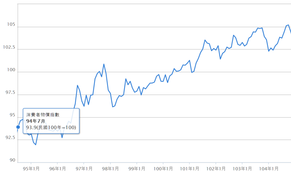
圖一 94 年至 105 年 1 月消費者物價指數