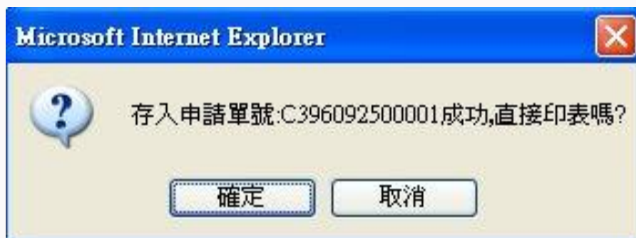
圖 5-1-3F 毀損報廢作業畫面

出現以下訊息，表示成功！可以印出其報廢毀損單據做留存依據。如圖 5-1-3F 所示。