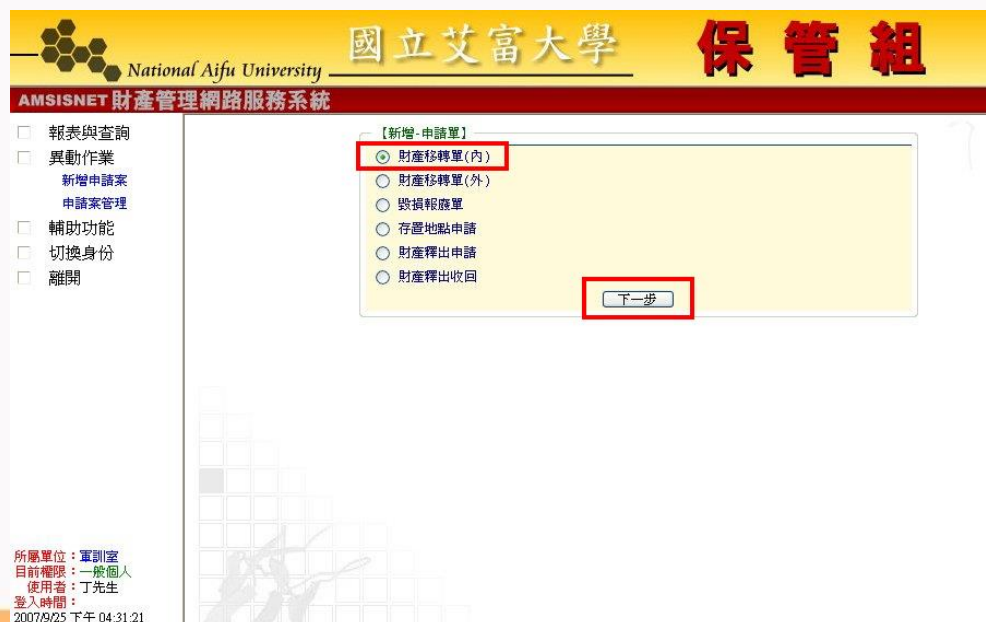
圖 5-1-1A 移動單(內)作業畫面

【異動作業】→[新增申請案]→[財產移轉單（內）]→『下一步』。如圖 5-1-1A 所示。