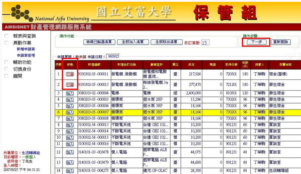
圖 5-1-3D 毀損報廢作業畫面

確認其被選取的資料，其狀態為【已點選】者，請按『下一步』。如圖 5-1-3D 所示。 【全部加入清單】即可將全部資料做選取動作。【全部移出清單】則可將全部資料清除。【自訂筆數】則可由使用者自行指定本頁所需顯示資料之筆數。