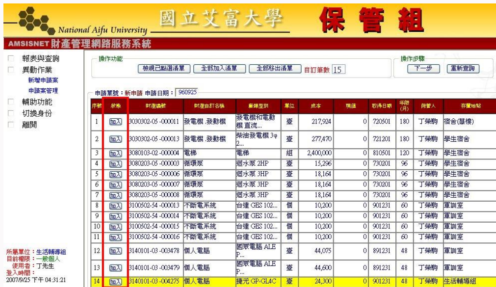
圖 5-1-3C 毀損報廢作業畫面

資料帶出後，請在【狀態】欄位中，選取欲報廢、毀損的資料。如圖 5-1-3C 所示。