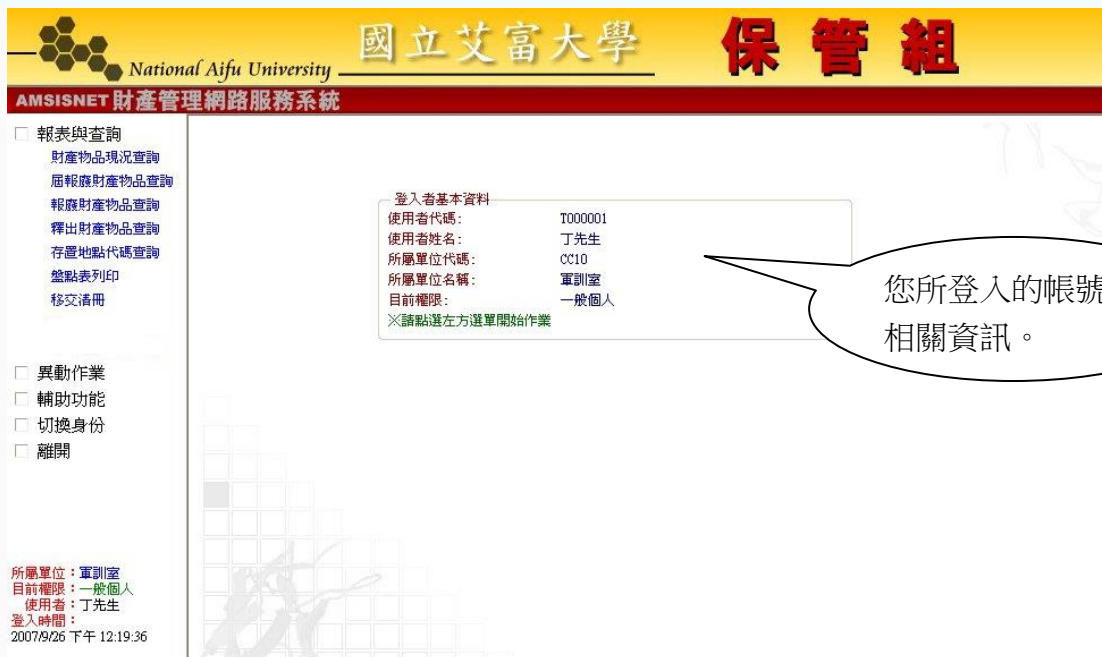
圖 1-3 財產管理網路登入成功畫面

左側功能列的【報表與查詢】選項中，一共有七個子選單，按下【報表與查詢】即可展開或收縮此子選單。下列針對此子選單的各個功能進行介紹。