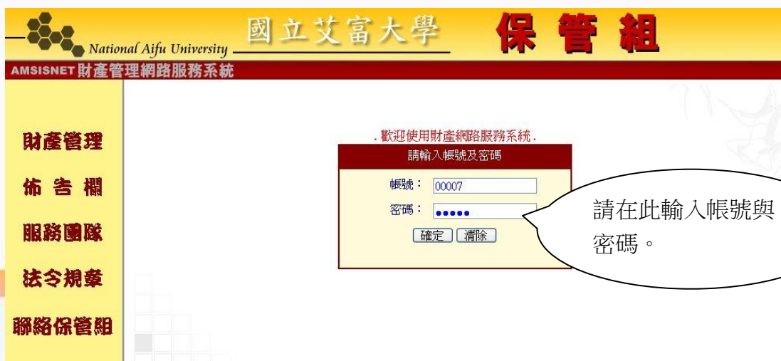
圖 1-2 財產管理網路登入畫面

選擇【財產管理】功能，會出現輸入帳號密碼的視窗，輸入個人的帳號密碼之後，如圖 1-2 所示，若確認無誤，則會進入到財產管理系統的主畫面，左列的功能選單是可選取的財產管理網路服務功能，右側是各功能相對應介面。當登入進去時，預設會出現個人基本資料。如圖 1-3 所示。