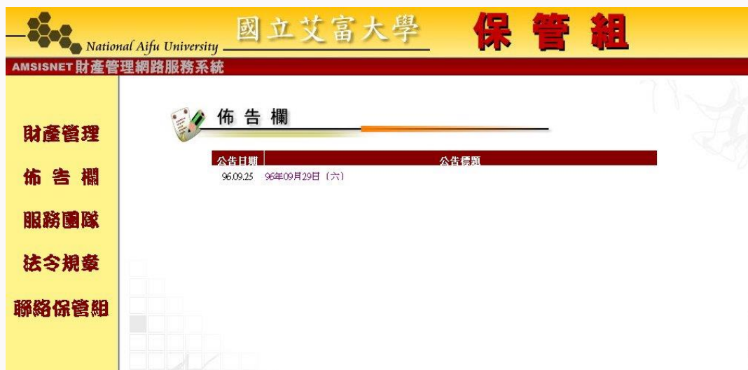
圖 1-1 財產管理網路服務系統首頁

欲使用財產管理網路服務系統的同仁，首先必須先開啟瀏覽器，在網址列的地方輸入網頁位置 http://www.nafu.edu.tw/amsisnet/ (請自行填入)，按確定之後，就可以連結到本財產管理網路服務系統首頁，其畫面如圖 1-1 所示。