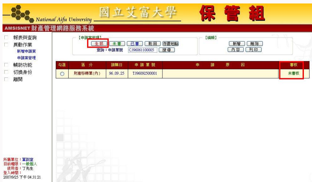
圖 5-1-1G 移動單(內)申請案審核畫面

點選【異動作業】→[申請案審核]→[全部]，即可看到此筆的移轉單號。此單據目前狀態為：未審。如圖 5-1-1G 所示。