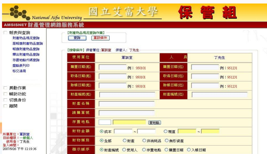
圖 1-4 財產物品現況查詢介面 第 2 頁，共 15 頁

此功能可以查詢單位內人員目前所保管之財產與物品。如圖 1-4 所示，輸入個人欲查詢資料的條件，如購置日期、財產編號、財產名稱、存置地地點等條件。其中，存置地地點欄位可以直接輸入存置地地點代碼或直接點選【查地點】按鈕，其操作方式可參考 1-5 節存置地地點查詢說明。點選該置放地點之後，系統即會將該置放地點帶回。需注意的是，欲查詢的財產，必須完全符合所設定的條件時，才會被搜尋出來。