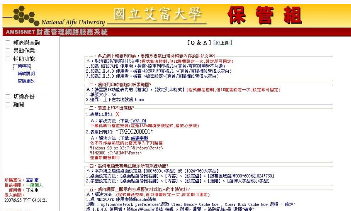
圖 2-1 問與答

針對使用者在使用本系統時，常遇到的問題進行整理成為本篇問與答，希望能夠減少使用者在使用上的困擾。如圖 2-1 所示。