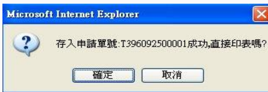
圖 5-1-1F 移動單(內)作業畫面

出現以下訊息，表示移轉成功！可以印出其移轉單據做留存依據。如圖 5-1-1F 所示。